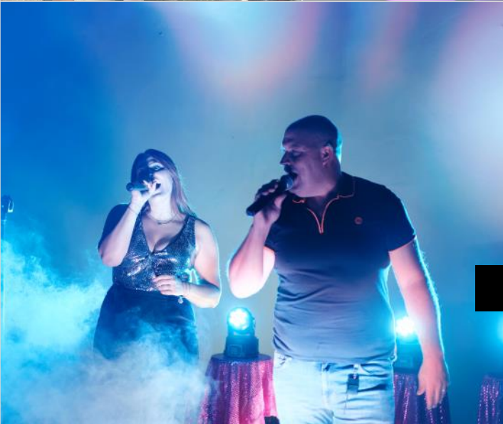
Marchés Nocturnes de la MJC