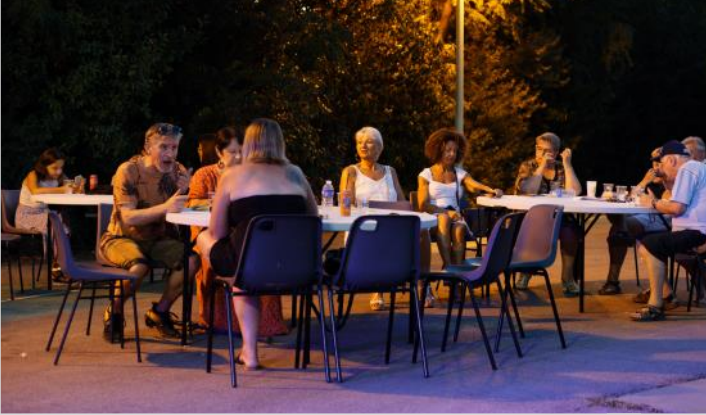
Soirées Guinguettes du Comité des Fêtes